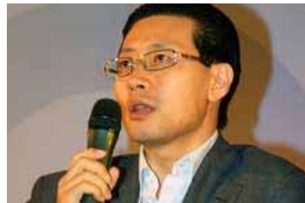
沈南鹏，创始及执行合伙人 红杉中国基金

Neil N. Shen, Founding Managing Partner Sequoia Capital China,