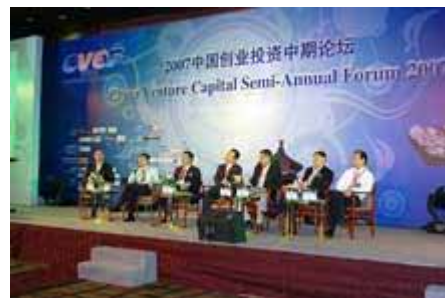
专家组讨论 Panel Discussion