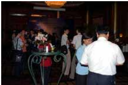
欢迎酒会现场 Cocktail Reception