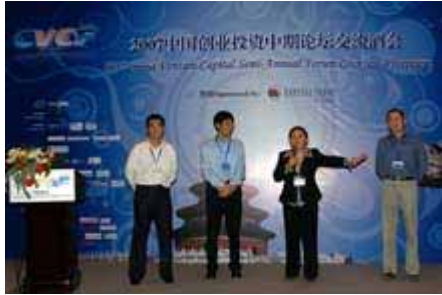
今日资本赞助 Sponsored by Capital Today