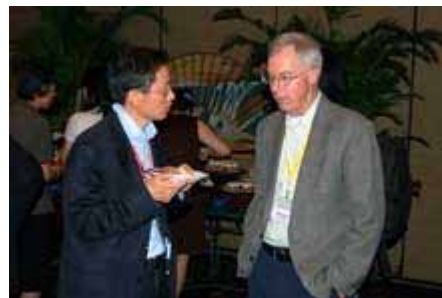
交流酒会 Cocktail Reception