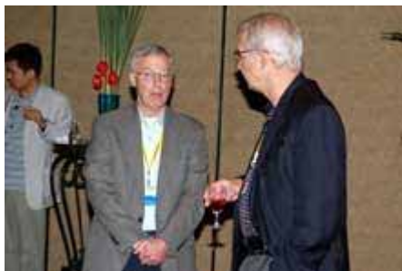
交流酒会 Cocktail Reception