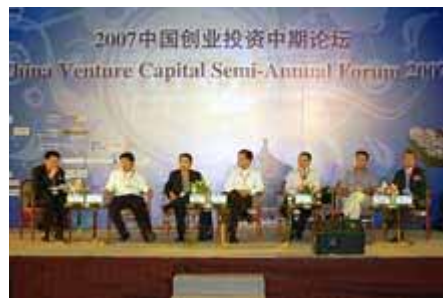
专家组讨论 Panel Discussion