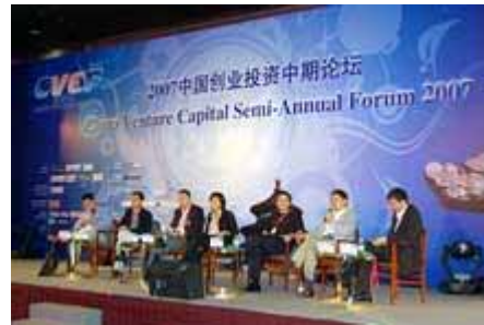
专家组讨论 Panel Discussion