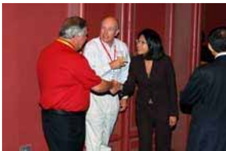
酒会现场交流 Cocktail Reception