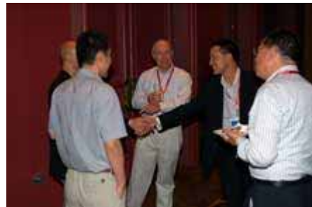
欢迎酒会现场 Cocktail Reception