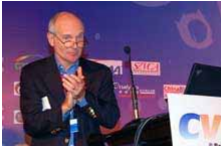
主办方致欢迎辞 Welcome Speech