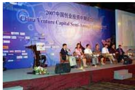
专家组讨论 Panel Discussion