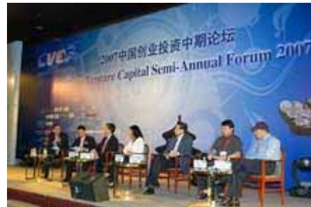
专家组讨论 Panel Discussion