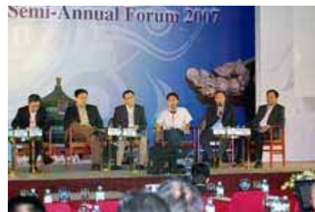
讨论现场 Panel Discussion