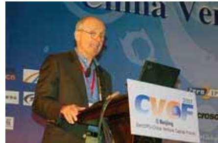
主办方致欢迎辞 Welcome Speech