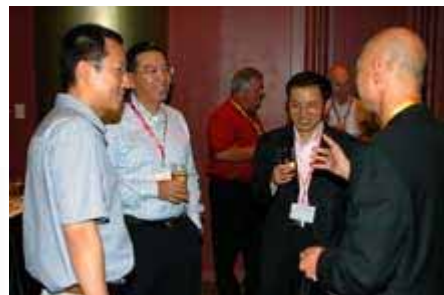
酒会现场交流 Cocktail Reception