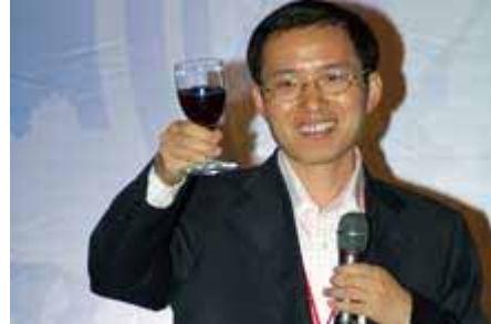
主办方致欢迎辞 Welcome Speech