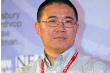
季琦，董事长兼首席执行官 汉庭酒店连锁 Qi Ji, Chairman & CEO Hanting Hotels