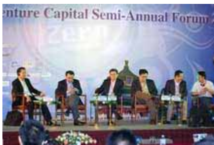
讨论现场 Panel Discussion