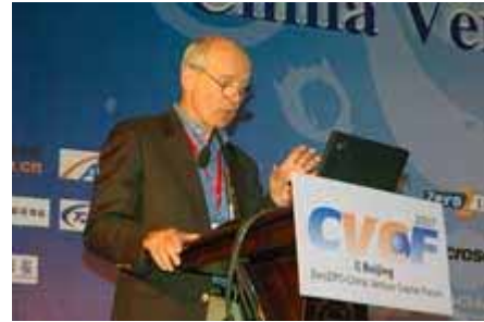
主办方致欢迎辞 Welcome Speech